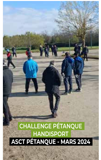
CHALLENGE PÉTANQUE HANDISPORT ASCT PÉTANQUE - MARS 2024