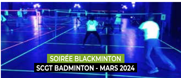
SOIRÉE BLACKMINTON SCGT BADMINTON - MARS 2024