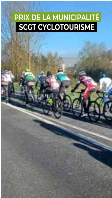
PRIX DE LA MUNICIPALITÉ SCGT CYCLOTOURISME