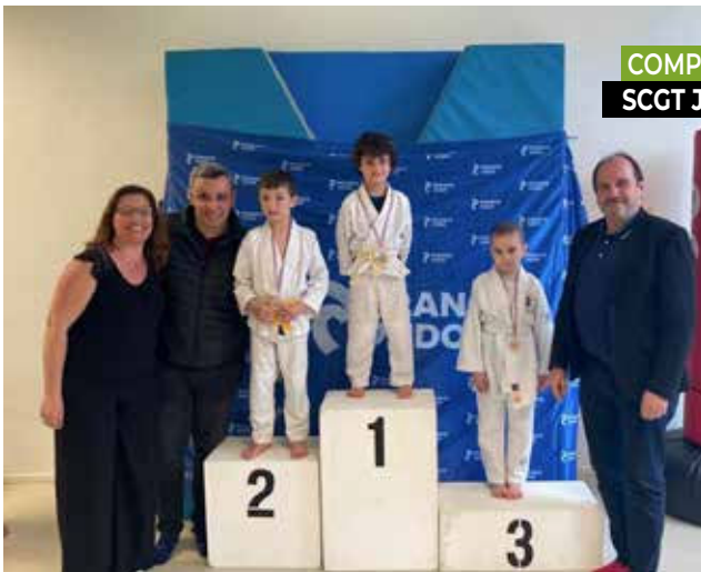
COMPÉTITION DE JUDO SCGT JUDO - MARS 2024