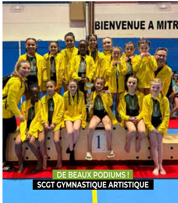
DE BEAUX PODIUMS ! SCGT GYMNASTIQUE ARTISTIQUE