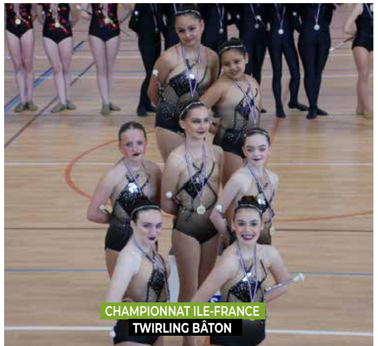
CHAMPIONNAT ILE-FRANCE TWIRLING BÂTON