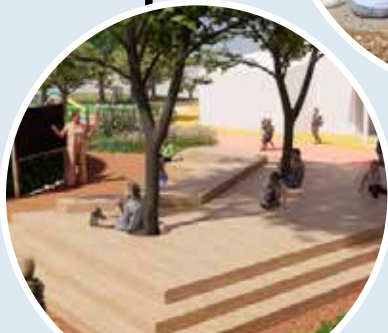
ÉCOLE DU MOULIN À VENT TRAVAUX PRÉVUS ÉTÉ 2025