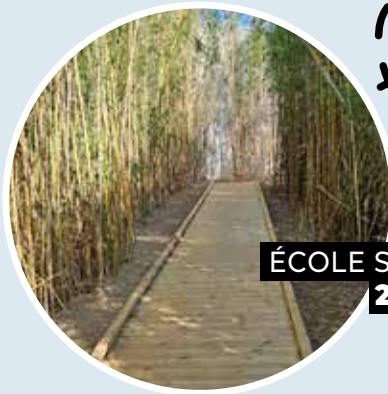
ÉCOLE SANTARELLI 2023